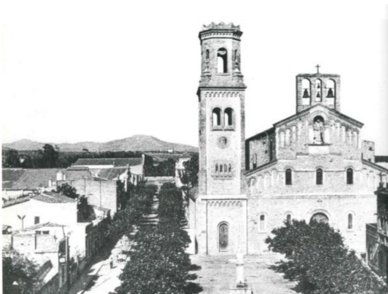
Plaça de la vila de Sant Feliu de Llobregat abans de 1936

Gràcies, mossèn, el seu record estarà sempre amb mi.