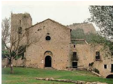
Sant Pere de la Portella