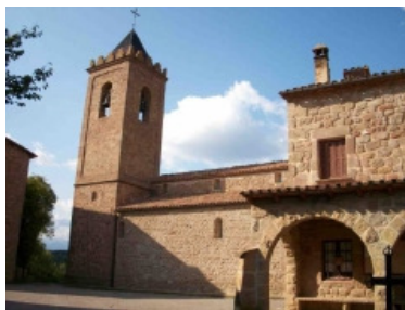
Sant Andreu de Sagàs